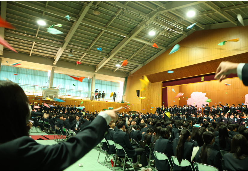
在校生が飛ばす紙飛行機を見上げる卒業生の様子

3月6日(金)に予餞会が行われた。生徒会による新たな試みや有志企画、部活動の発表など、多彩な演出で会場は大きな盛り上がりを見せた。「激動・感動・始動」をテーマに、在校生から卒業生へ感謝とエールが送られた。企画担当若手や卒業生へ感謝を取材した。(菊池ひとみ)