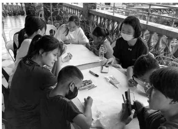
エンデラン大学 ボランティア活動の様子