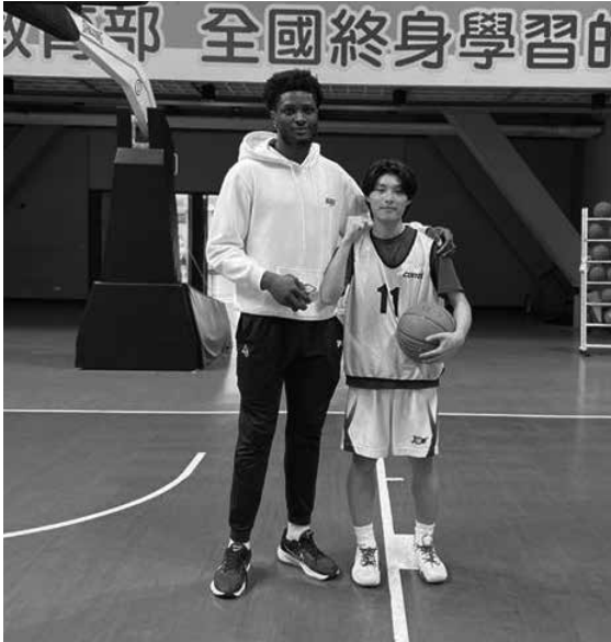
スポーツ交流（中国文化大学）

イ体験、スポーツの交流試合など、それぞれ自分の特技や希望に応じて、特別な体験をすることができた。より専門的で高いレベルの国際交流ができたことは生徒たちの自信になり、楽しくグローバルな視点で、自分の専門性を高める貴重な機会になったようだ。