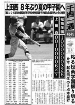
8年ぶりの夏の甲子園出場を報じた号外

新聞委員会編集局は今年度も様々な分野で活躍し世間を賑わせた。今年度の活動について、時系列に沿って振り返っていききたい。まずは、野球部の8年ぶりの夏の甲子園出場に際して行った活動について振り返る。夏の選手権大会は数年前から取材活動を行っているが、今年度は下馬評も高かったため