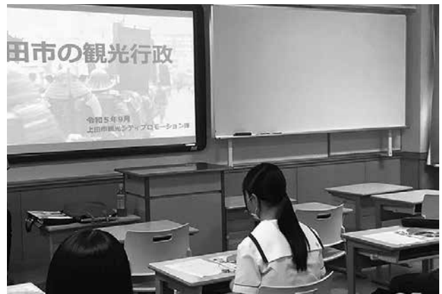
上田市 出前講座を利用