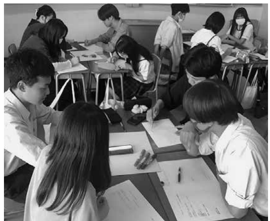
学校の枠を超えた話し合いの様子

九月二十三日は佐久大学のオープンキャンパスがある日であったが、本校生徒は特別プログラムにて参加した。今回は小児モデル、バイタルサイン測定、点滴調節等を行った。通常のオープンキャンパスでは、このような実習