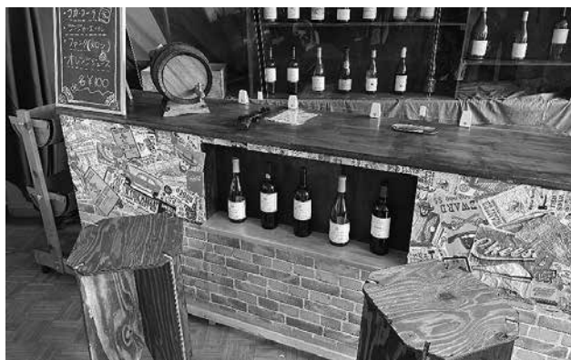
販売企画優秀賞「ウエスタンBAR」

担任初年度では、初めてのホームルームから始まり、すべてが手探り状態でしたが、学校行事に力を入れて取り組んできました。担任を受け持つ前は生徒会顧問として学校行事に関わっていましたが、授業だけでは得ることができない経験がたくさんありました。学校行事を通して、クラスの生徒には主体性や協働性を学んでほしいという思いが強くなりました。旧一年三組の皆さんと過ごした一年間の中で、特に印象的だった行事の一つは、文化祭です。ルーム長を中心に企画を立案し、「ウエスタンBAR（販売企画）」を実施しました。コロナ禍での開催であったため、感染対策にも気を配る活動でしたが、一人一人が知恵を出し合い、見事な団結力でウエスタンBARを成功させました。この取り組みは全校から評価され、一年生ながら販売部門で優秀賞を獲得することができました。文化祭を通じて、旧一年三組の皆さんは主体性や協働性を学びつつ、クラスの絆を一層深めてくれたと思っています。私自身も、改めて生徒とのつながりを密に感じ、担任だからこそ理