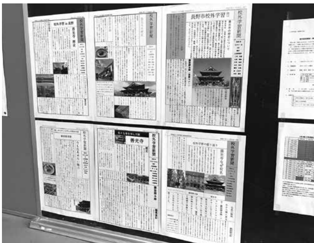
グループごとに発行した「校外学習新聞」

また事後学習として、グループごとのテーマに沿って調べたことや発見した新たな魅力を新聞にまとめました。各自タブレットを使用し、調べ物をしたり、新聞を編集しているファイルグループで共有して編集しやすくするなど、各グループで工夫しながら新聞制作する姿がみられました。タブレット使用の仕方が不慣れな部分があり、四苦八苦する場面も見られましたが、グループで協力しながら乗り越えました。新聞は写真等を使用し、人目を惹くようにレイアウトや色遣いにもこだわり、読みやすく楽しめるものを制作することができました。 こういった、興味を持ったことをタブレットなどで調べて内容を深めたり、観る側に立って内容の理解しやすい発表を心がけたりする経験が、今後も継続して行われる探求学習につながって行ければより良いと思います。