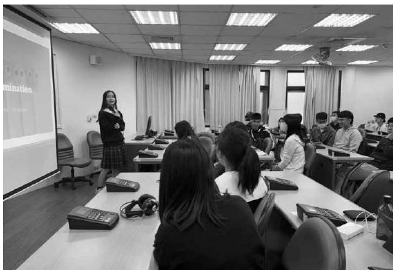
探究プレゼンテーション（中国文化大学）

台湾修学旅行の成果を大きく二つ挙げるとすると、国際体験の実現とルーム長会の成長であると感じる。今回の旅は生徒にとって、グローバル社会を生きる上で「世界」を感じる旅になったことは間違いない。生徒の旅記からは、気候、言語、街の風景、食べ物、貨幣価値、人柄などについて、たくさんの方の相違点と共通点を発見し、海外の国や人への興味関心が高まったことが感じられる。加えて、自分がアウェイの地で少数派になったときの不安な気持ちから、異国で歓迎され受け入れられた時の喜びと安心感を味わったことで、異文化や外国人をポジティブに親近感をもって捉えられるようになったようだ。さらに、言語の壁を越えてコミュニケーションが