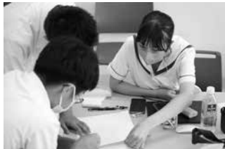
かごしま総文交流新聞作りの様子

十月には軽井沢で行われた日本新聞協会主催第七十六回新聞大会に招待された。新聞大会とは、朝日新聞・読売新聞・毎日新聞などの大手を含めた全