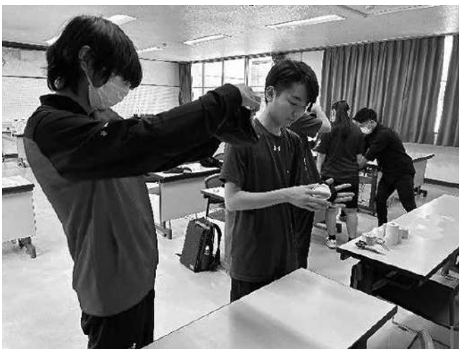
テーピングについての実習

参加した生徒からは「怪我やテーピングについてだけでなく、資格や社会のことも知ることができた」や「柔道整復師の仕事等を詳しく聞き、理学療法師との違いを知ることができた。」などの声があった。部活動中の怪我への対応等、生徒の実生活に生かされる貴重な機会であったと考える。