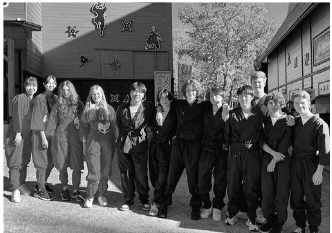
留学生 週末のアクティビティの様子 忍者村にて

日本全体における留学生数はコロナ禍で大幅に減少しましたが、現在はコロナ以前よりも増加傾向にあります。学生だけでなく、最近ではリモートワークやワーケーションの傍ら海外現地で留学を両立する「リモートワーク留学」をする人もいるそうです。以前、複数学年により留学に関する意識調査をしたところ、留学を経験したいと答えた生徒の半数以上は「大学などに在学中に留学したい」「タイミングはわからないがいつか留学したい」のいずれかを回答していました。上田西高校在学中の留学、国際交流の経験や見聞きした内容が、さらなる興味へのきっかけになることを願うばかりです。来年度も引き続き多くの生徒が海外へ目を向け、また海外から上田西高校へ学生が訪れてくれることを願います。