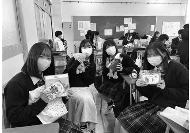
グローバルクラスメート おみやげ交換プロジェクトの様子

今年度からアメリカ・テネシー州にあるオースティン・ピー州立大学（APSU）とパートナーシップ協定を結びました。前述したグローバルクラスメートプログラムでの本校の取り組みが高く評価され、ご紹介のお声かけをいただき提携の運びとなりました。APSUは、芸術や文学、科学、教育、ビジネスなどさまざまな学部を構成、バスケットボールやテニスを中心とし