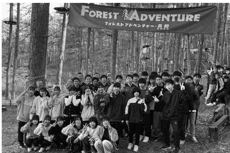
フォレストアドベンチャーでの様子

校外学習当日は、一日の行程を通してグループごとのテーマに沿った行動を心がけました。長野県にはこんなに身近にまだ知らない魅力あるもの