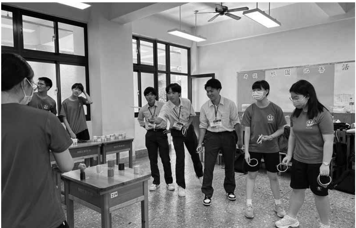
文化交流（文華高級中学）

保護者の皆様、台湾の交流校の皆様、旅行業者様、学校、学年など多くの関係者のお力添えで、台湾修学旅行を成功裏に終えることができました。感謝申し上げます。今回私たちが学んだすべての経験を西高教育の力にし皆様にお返しできるよう、引き続き学年一同取り組んでまいります。