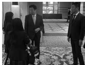
オリックス球団の福良淳一GM、中嶋聡監督と生徒

の朝刊に掲載する記事を信濃毎日新聞社の記者とともに執筆するという機会も頂いた。読者からお金をもらっている記事製作に関われたことと、全国のプロの新聞記者を前に堂々と質問できたことは生徒の印象に大きく残ったはずだ。同じく十月の下旬にはプロ野球ドラフト会議が行われ、本校野球部の横山聖哉選手がオリックス・バファローズから一位指名を受けた。これはただ事ではない。指名自体は事前に予想していたが、一位は別格だ。この出来事に關しては仮契約や表敬訪問などほぼ全ての動きに取材で帯同した。さらに特別な許可をいただき、十一月に大阪で行われた新人選手入団会見にも足を運び、その様子が全国を賑わせた。オリックス球団の編成の方々は生徒と積極的にコミュニケーションをとってくださり、福良GM、小松スカウト、山口スカウト長ら往年のビッグネームと談笑する生徒の様子は少し衝撃的であった。