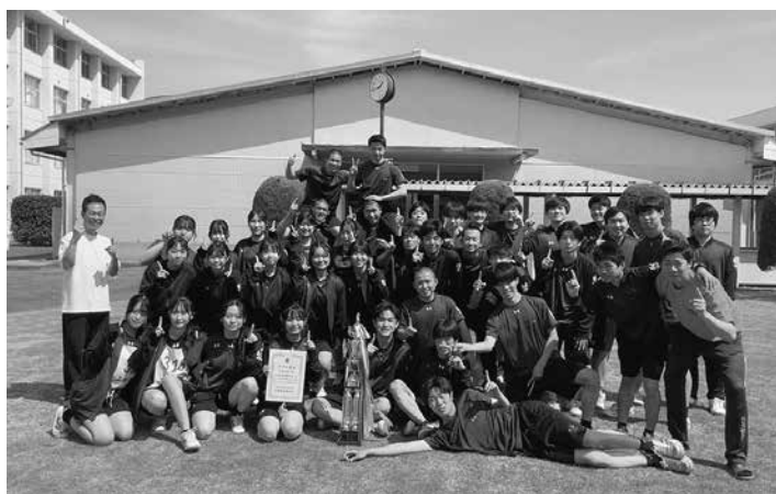
強歩大会 総合優勝

最終学年となった皆さんは、昨年の悔しさを晴らし、見事に強歩大会で優勝を果たしてくれました。受験シーズンでは、志望校に向け、皆さんと面接練習や志望理由書の作成に励んだ日々も私にとって貴重な時間でした。すべての面で担任の期待にこたえてくれた自慢のクラスです。皆さんが考えてくれた学級目標「大塚先生と思いついたくさん辛い時も勝たんしか三組」もついに終わりを迎えようとしています。生徒に恵まれ、無事に卒業式を迎えることができ、私自身も教員として一歩前進できたと思っています。卒業後も皆さんの担任であることは変わりません。困ったときはいつでも相談してください。これからも皆さんの活躍を期待しています。