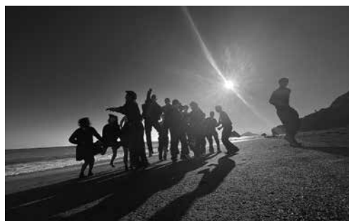
修学旅行にて撮影

この三年間で得られた実感をもとにまた私自身が成長できるように職務に当たっていききたいと思えます。