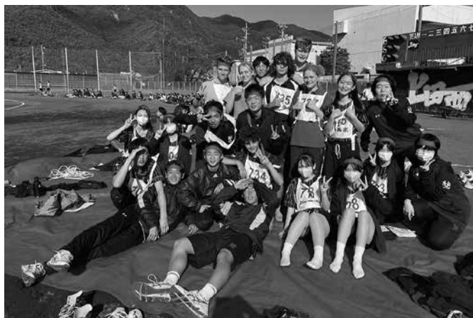
留学生とクラスメート クラスマッチにて

短期留学では、七月から八月にかけて九名がフィリピンのエンデラン大学語学留学に参加しました。今年度は、フィリピンの貧困層が住む地域へ行き、子ども達と触れ合うボランティア活動の日があり