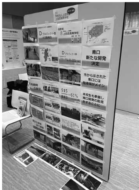
ポスターセッション本校のパネル

まずお二人の先生方に各校の取り組みをお話いただきました。その発表をベースにしながら、この分科会ではユネスコスクールに加盟している先生方と各校の取組状況や課題等についてグループワークで話し合いを行いました。学校全体でユネスコスクールに加盟している意識向上が必要なることを改めて感じさせられました。