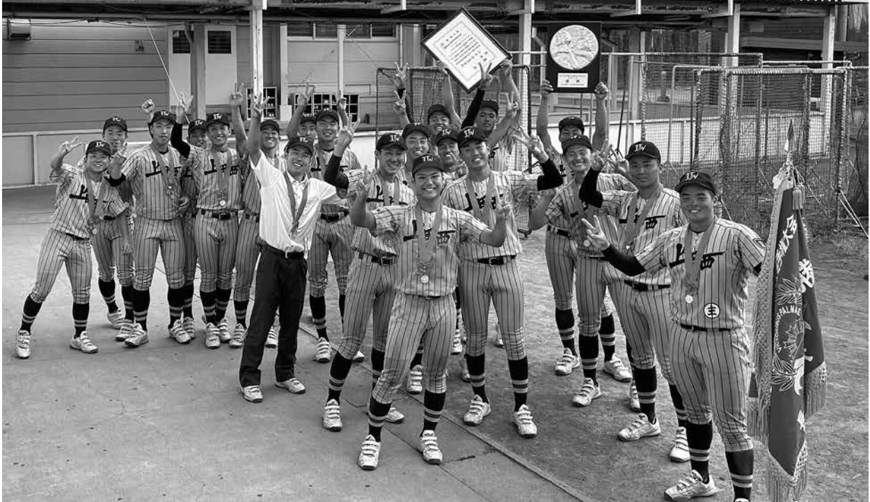
優勝報告会 入場直前の硬式野球部員