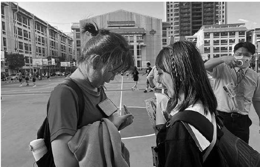
ホームステイ（文華高級中学）

台湾修学旅行を計画段階から一緒に作ってくれたルーム長会は、今回の成功で、生徒たちと先生方の信頼を得て、その求心力を高めた。ルーム長達は、自主規律の制定、クラス別コースの業者さんとの調整、現地の点呼や連絡など多岐にわたる活動を任せられ、自由と責任を知り、自治の力を付けてきた。そのスキルを買われ、学校全体のリーダーである生徒会役員になった生徒も多い。また、修学旅行後には新ルーム長会が発足したが、新ルーム長会役員も全員が立候補で決まった。前任者