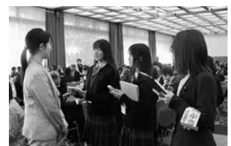
信濃毎日新聞社の記者とともに取材活動を行う生徒

国各地の新聞社が一堂に会する大会で、ゲストに三谷幸喜氏が招かれる大会と言えばその規模は想像できるだろう。そして2023年度新聞協会賞を受賞した記者達に壇上で直接インタビューする機会を得た。また、翌日