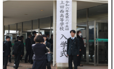
記念撮影を行う新入生

会場には卒業式に引き続き上田市の画家米津福裕さんが本校に贈呈してくれた江戸時代の天下無双力士で、東御市出身の雷電為右衛門のイメージに西高生