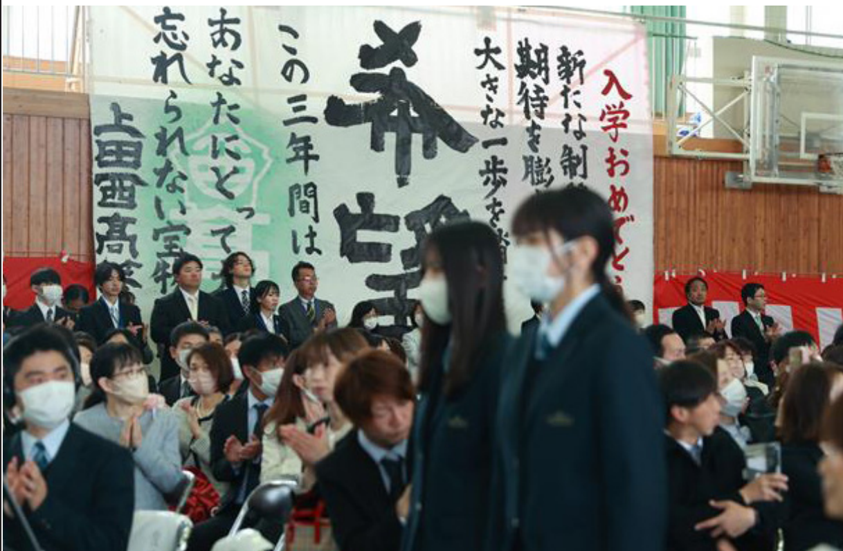
体育館に入場する新入生 体育館側面には生徒会ガイダンスで書道部が揮毫した「希望」の文字が