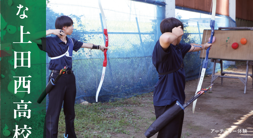
アーチェリー体験