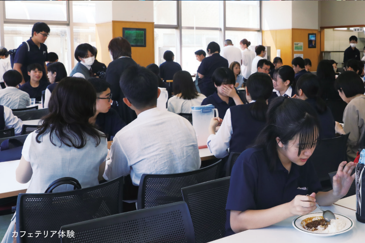
カフェテリア体験