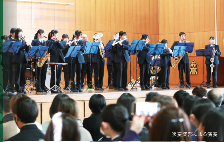
吹奏楽部による演奏